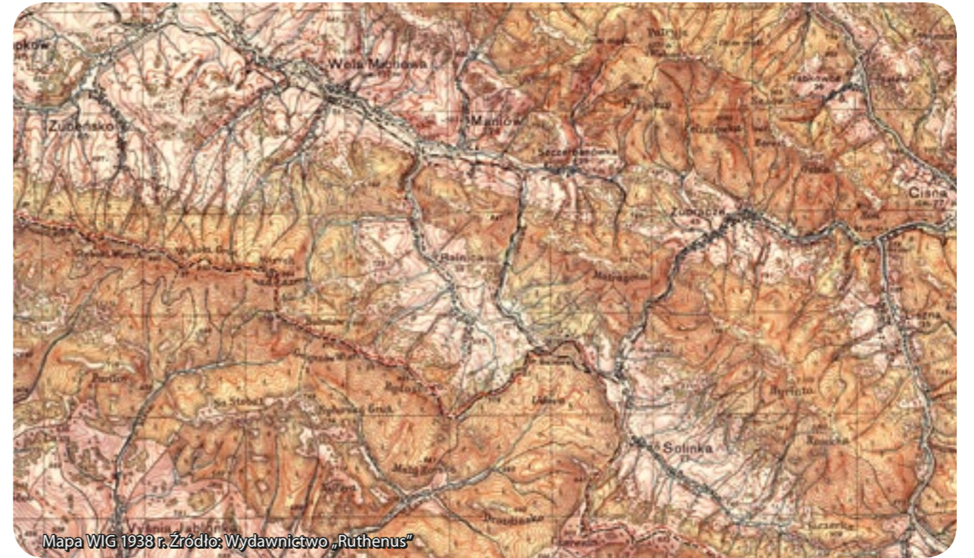
Mapa WIG 1938 r.