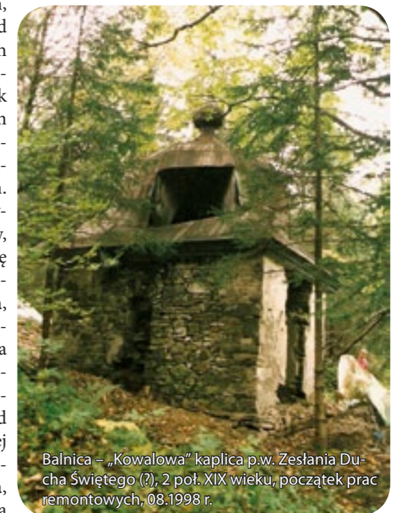
Balnica – „Kowalowa” kaplica p.w. Zesłania Ducha Świętego (?), 2 poł. XIX wieku, początek prac remontowych, 08.1998 r.