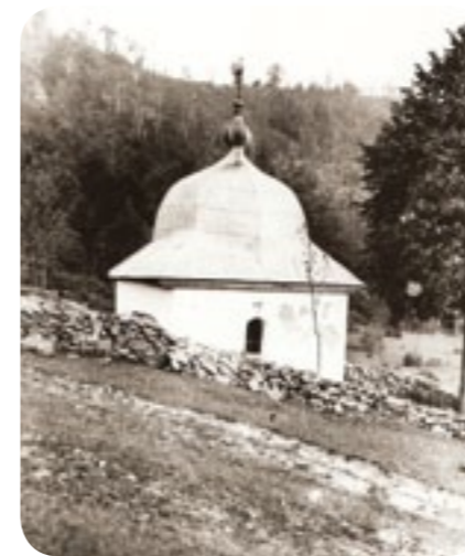
Balnica – „Kowalowa” kaplica p.w. Zesłania Ducha Świętego (?), 2 poł. XIX wieku, stan ok. 1910 r.

roku. Dobrze dziesięć lat później znaleźliśmy zdjęcie cerkwi, dzwonnicy, kostnicy i... murowanej kaplicy, o której opowiedział mi przyjaciel z Żubraczego, a o której myślałem, że po prostu już nie istnieje. Obszedłem cerkwisko, cmentarz, zrobiłem rysunki (nie posiadałem wtedy aparatu fotograficznego) i popędziłem w dół wsi, bo zaczęło się zmierzchać. Do domu kilkanaście kilometrów, a najwyższa pora znaleźć coś co podobno istnieje! Szedłem drogą przekonanym, że położoną za potokiem kaplicę – jak wskazywały mapy - dostrzegę z niej (dziś jest widoczna). Nie wiedziałem jak wygląda, ale miała być