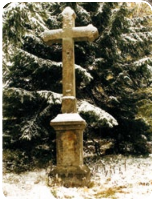
Krzyż zwany „pańszczyńnianym” z przełomu XIX/XX wieku, 10.2000 r.

Lata mijały, kolejne cmentarze, kolejne nagrobki, kolejne remonty, nie zapomniałem o kaplicy, ale też to jej wspomnienie nie było na tyle silne, żebym zajął się nią pomimo tego, że w 1996 roku ratowaliśmy nagrobki na cmentarzu w Balnicy i ustawiliśmy przewrócony krzyż zwany „pańszczyńnianym”. Piszę „zwany”, bo, sądząc po jego formie, pochodzi z przełomu XIX/XX wieku, co nie zmienia faktu, że mógł zastąpić starszy krzyż rzeczywiście postawiony w miejscu