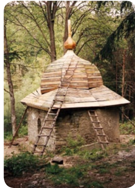
Balnica – „Kowalowa” kaplica p.w. Zesłania Ducha Świętego (?), 2 poł. XIX wieku, naprawiona i uzupełniona wieżba hełmu wraz z „cebulką”, 05.2001 r.

że ze zwieńczenia cerkwi i dzwonnicy. Jeden z nich, młodszy i lepiej zachowany, był jeszcze na miejscu w 1995 roku. Kiedy jednak dotarliśmy remontować tamtejsze nagrobki, nie udało nam się go odnaleźć, obawiam się, że został ukradziony... jak wiele podobnych krzyży. Robi się późno,