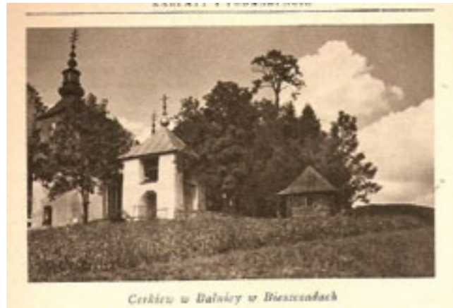
Nieistniejąca cerkiew, dzwonnica i kostnica w Balnicy.

która istnieje od lat blisko 40 (dzisiaj ponad 60-ciu) tylko na mapie i w pamięci ludzi, których tu nie ma. Gdzieś w pół drogi w dół natykam się w lesie na kamień z wrytym małym krzyżem, to chyba dobry znak, nigdy później go nie odnalazłem, choć dobre znaki nadal spotykam. Nie od razu trafiam na cerkwisko, mapa mapą, kompas kompasem, a krzaki krzakami, ale w końcu