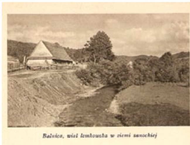
Balnica, wieś lewobrzeżna w ziemi sanockiej

cu moją uwagę przyciągają okazałe jesiony i ledwie widoczna kamienna podmurówka, stanowiąca, jak się okaże później, część zabudowań dzwonnicy. Są zdemolowane, rzecz jasna, nagrobki, jest także podmurówka cerkwi, dwa kute krzy-