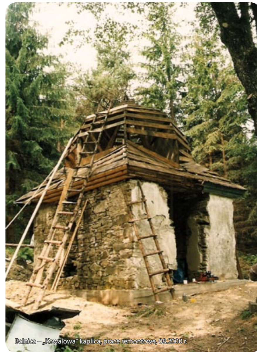
Balnica – „Kowalowa” kaplica, prace remontowe, 08.2000 r.