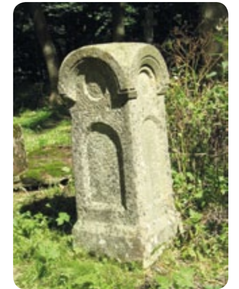
Berehy Górne, gm. Lutowiska – cmentarz greckokatolicki, piaskowcowy nagrobek NN, stan w 1995 r.; / fot. archiwum Magurycz

choćby dlatego, że dochodząc do cmentarza mijasz podmurówkę cerkwi p.w. św. Michała Archanioła (zbudowaną w 1820) w takiej bliskości, że gdyby stała zapewne przechodziłbyś pod jej okapami. Mijając ją mijasz też cmentarz pełen ludzi żywych, także tych żywych naszą pamięcią.